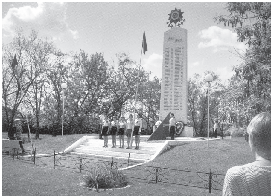
Село Новые Выселки Калининского района Мемориал «Односельчанам, погибшим в Великой Отечественной войне 1941-1945 гг.» Открыт 9 Мая 1975 г. к 30-летию Победы. Ежегодно 9 Мая у Мемориала проводится митинг жителей села, ученики Ново-Выселкской школы несут вахту Памяти. Фото 9 мая 2016 г.