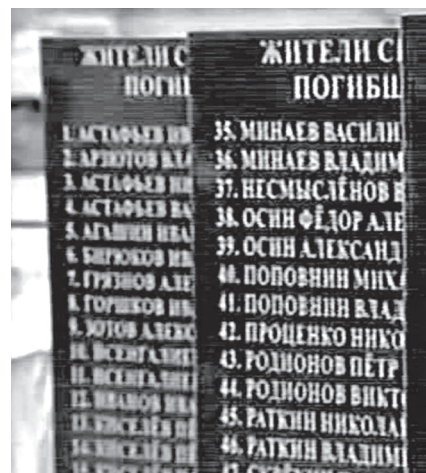
Стелы с именами участников Великой Отечественной войны сел Миусс и Карповка