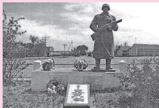
Так памятник выглядел в 1960-е годы

2016 год. Установлено дополнительно 8 гранитных стел с 7 фамилиями ветеранов войн, захороненных в братской могиле, 12 участников войны, умерших в мирное время, 2-х узниц, 175 тружеников тыла.