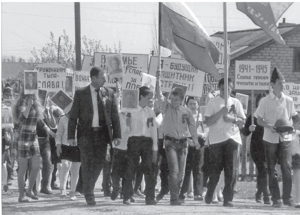
«Бессмертный полк». Шествие учащихся школы и жителей села Миусс Ершовского района. Май 2016 г.

УМИРАЯ — ПОБЕЖДАЛИ, ВЫЖИВАЯ — СОЗИДАЛИ. ПОТОМКИ! ПОМНИТЕ О ПОДВИГЕ СВОИХ ПРЕДКОВ!