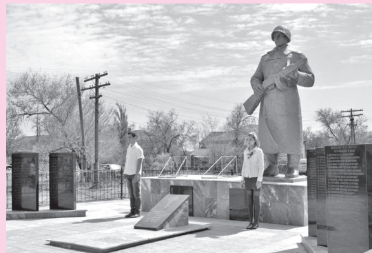
7 мая 2013 года