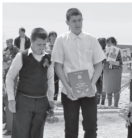
Книга Памяти Саратовской области передается в Музей боевой славы Ершовского округа