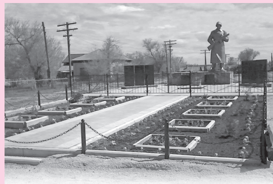
9 мая 2015 года