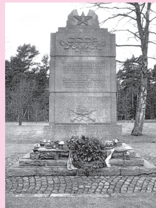
Мемориал Берген-Бельзен. Кладбище военнопленных Витцендорф. Германия. Фото П. Ваннингер, 2010 г. Здесь погиб в плену Кашкин И.Я. (Балтайск. р-н)