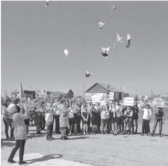
Учащиеся школы выпускают в небо голубей, как символ мира на Земле