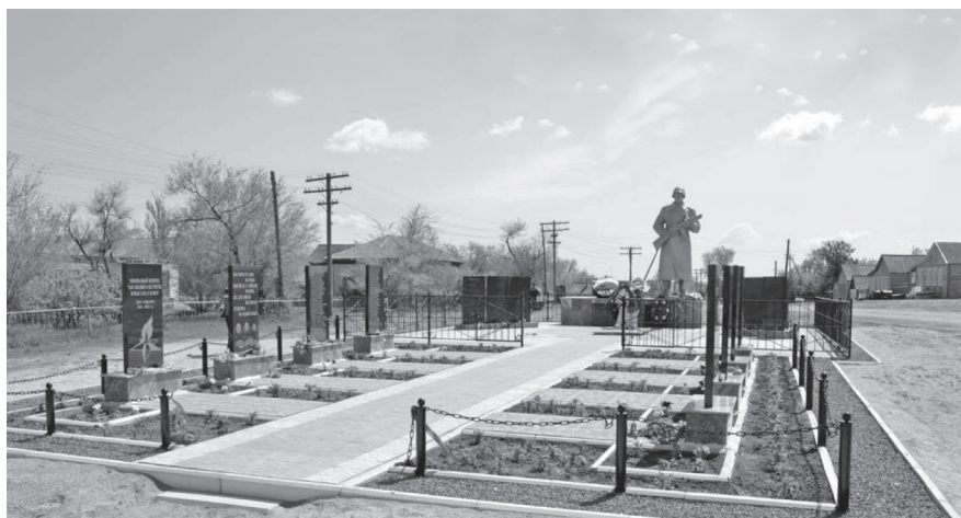
Мемориальный комплекс «Вам, ушедшим в бессмертие, вечная слава и память!» 7 мая 2016 года